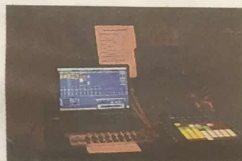
Ved hjelp av elektronikken, ble komposisjoner bygd opp underveis. Lag på lag med lyder gav stadig nye valører på musikkstykkene.